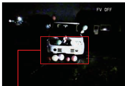
カメラ内蔵 AGC による補正画像