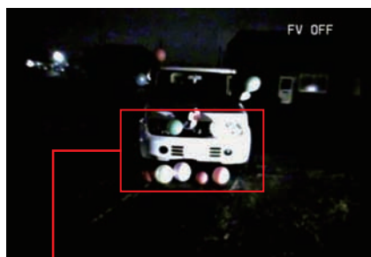
カメラ内蔵 AGC による補正画像